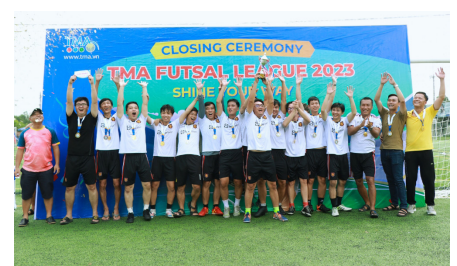
(Đội hạng Ba League C - DC226)