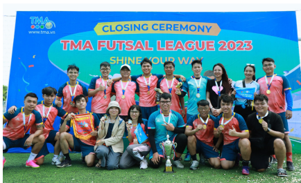
(Đội vô địch League B - DC87)