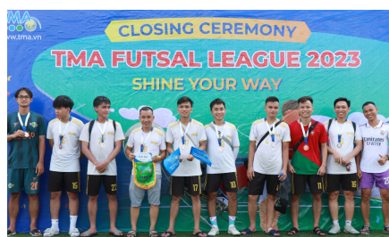
(Đội hạng Nhì League C - 4B)