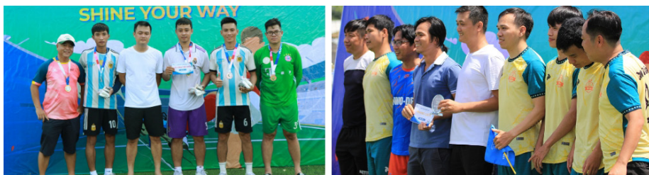
(Trao giải các danh hiệu League A)