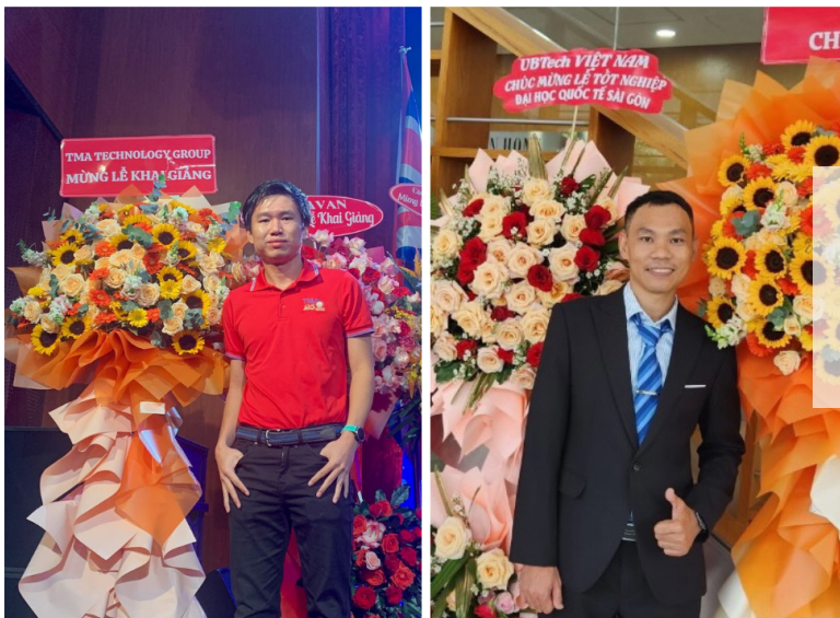
Lễ Trao bằng tốt nghiệp tại Trường ĐH Quốc tế Sài Gòn (23/08/2023)

Ngoài các buổi làm việc trực tiếp cùng nhà trường, TMA còn có cơ hội gặp gỡ, kết nối cùng các bạn sinh viên tại các buổi lễ quan trọng: