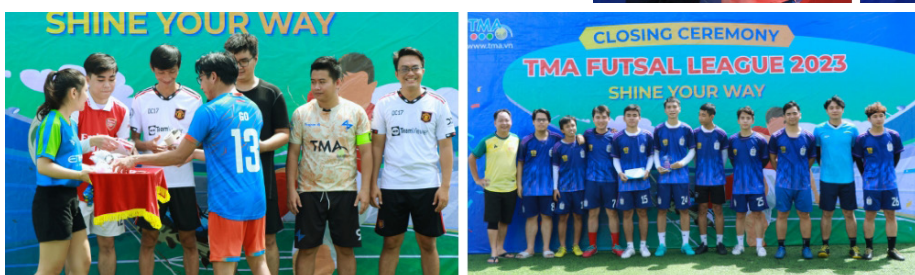
(Trao giải các danh hiệu League C)