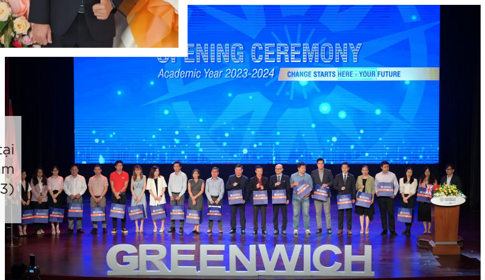
Lễ Khai giảng tại Trường Greenwich Việt Nam (24/08/2023)