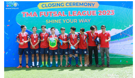
(Đội hạng Ba League B - DC12)