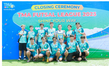
(Đội hạng Nhì League B - DC24)