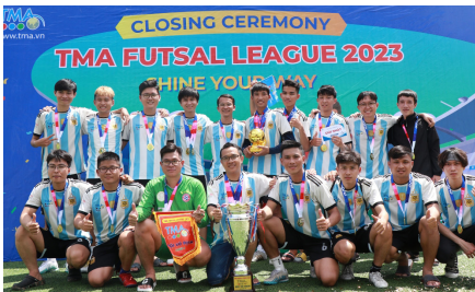
(Đội vô địch League A - DC27A)