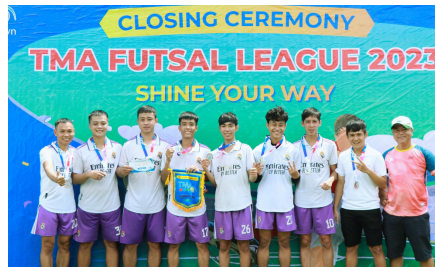
(Đội hạng Nhì League A - DC11)