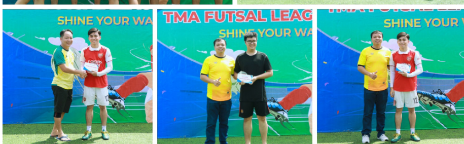
(Các “Chém gió đại hiệp”)