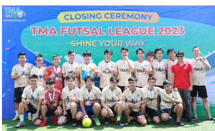
(Đội vô địch League C - DC17)