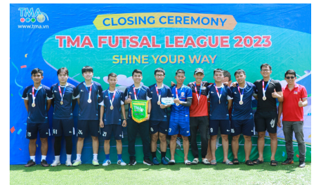
(Đội hạng Ba League A - DC13)