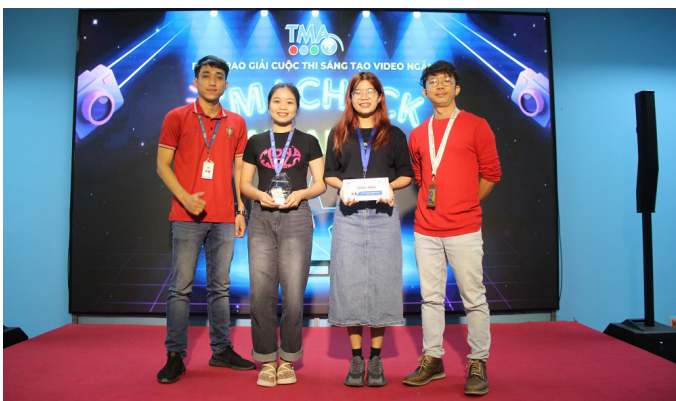
Giải Nhì “Vườn ươm năng lượng tích cực” (Program 2 - DC29)