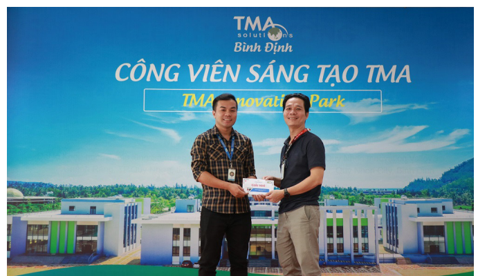
Giải Nhì “Thanh xuân của chúng ta” (TIP Department)