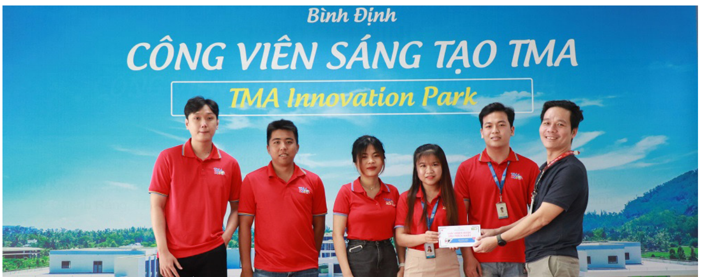
Giải Video được yêu thích nhất “Girl IT bắt trend” (AngelTeam - DC13-ext)

Sau nhiều thời gian cân nhắc kỹ lưỡng, “vò đầu bứt tóc”, chấm điểm công tâm, BTC đã gọi tên những siêu phẩm xứng đáng cho các giải thưởng “khủng” và tổ chức lễ trao giải cho các tác phẩm đạt giải.