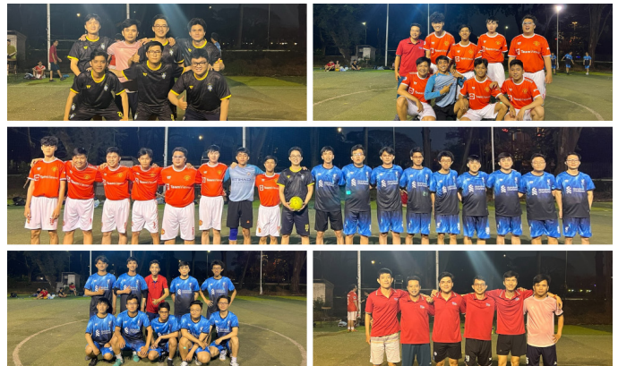
(DC29 Futsal Cup)