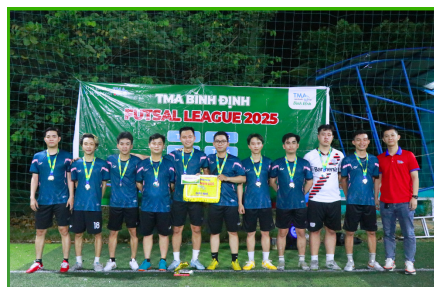
Đội hạng Nhì: TIP-1