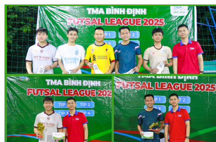
Các danh hiệu cá nhân

Chỉ còn vài trận đá bù, TMA Futsal League 2025 sẽ khép lại lượt đi và khởi động lượt về đầy kịch tính. Hãy tiếp tục theo dõi lịch thi đấu và đến sân PM Sport vào sáng thứ 7 hằng tuần để cổ vũ cho các chàng trai TMA!