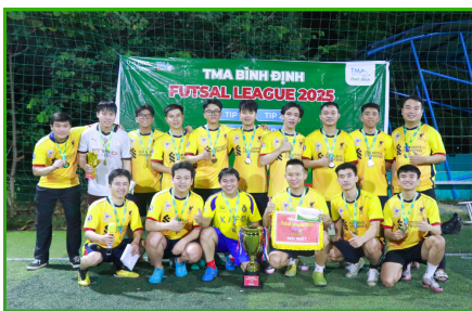
Đội vô địch: TIP-2

Ở League B, DC24 và DC1 đang cạnh tranh gay gắt cho ngôi đầu BXH. Dù cơ hội là mong manh, biết đâu bất ngờ, sau trận đá bù, DC1 vẫn có thể chiếm lấy "cơ ngơi" mà DC24 đã dày công vun đắp từ đầu mùa giải đến nay. Ngoài ra, DC4, DC9-19 và DC15-18 cũng là những điểm sáng đáng chú ý của League B. Với đội hình dày dặn kinh nghiệm, họ có thể có những màn lội ngược dòng ngoạn mục và khiến đối thủ phải nhận lấy trái đắng nếu không cẩn trọng.