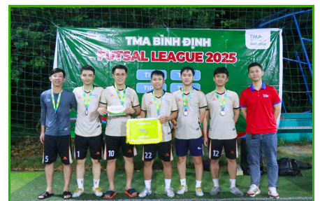
Đội hạng Ba: TIP-4