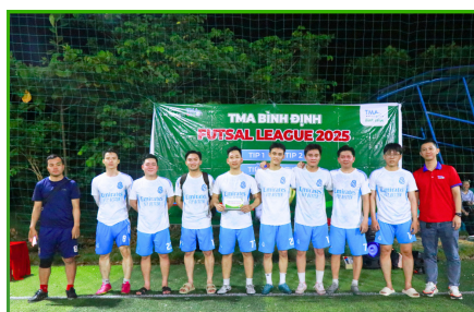
Đội Phong cách: TIP-3