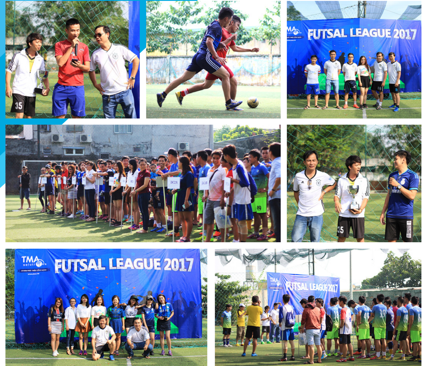
TMA Futsal league 2017 sẽ diễn ra đều đặn vào mỗi sáng thứ 7 hàng tuần tại sân K334, Tân Bình. Các bạn nhớ đến xem và cổ vũ cho các chàng trai của chúng ta nhé!

Tại lễ khai mạc, đại diện từ các đội và tổ trọng tài đã tuyên thệ để có một giải đấu thành công, fair play. Đặc biệt, đội trưởng nhà đương kim vô địch giải 2016 – DC6 đã thể hiện rõ sự quyết tâm giữ CUP của đội, cổ vũ thì ít mà thách thức thì nhiều lòng quyết tâm từ các đội khác. Quyết tâm này thể hiện rất rõ ngay từ vòng đấu đầu tiên, dưới cái nắng nhen thớ của sân K334, các trận cầu này lửa diễn ra với tinh thần "không khoan nhượng".